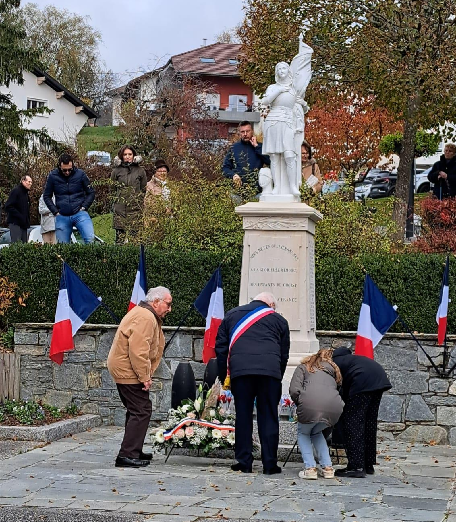
Pose des gerbes à la commémoration du 11 novembre 2024